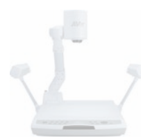
▶ Visualiseurs plateforme PL50